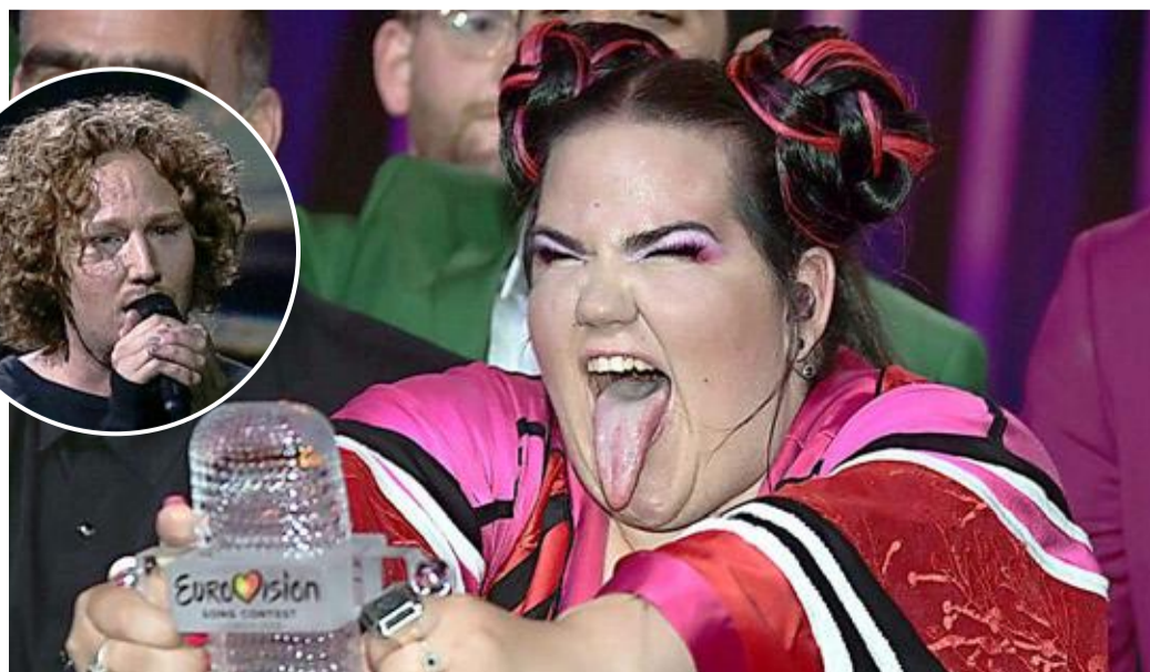
Netta aus Israel freut sich beim Finale des 63. Eurovision Song Contest über ihren Sieg. Kleines Foto: Michael Schulte, der sich in Lissabon auf Rang vier sang.

Lissabon. Deutschland ist mit Michael Schulte beim Eurovision Song Contest auf dem vierten Platz gelandet und hat seine Serie von Misserfolgen bei dem Musikwettbewerb beenden können. Israel holte mit der Sängerin Netta in der Nacht zu gestern den Sieg. Es ist der vierte Triumph Israels in der Geschichte des ESC – zuletzt gewann vor 20 Jahren die Sängerin Dana International. Für Deutschland ist es die beste Platzierung seit Lena Meyer-Landruts Sieg vor acht Jahren. In den vergangenen drei Jahren landete die Bundesrepublik stets ganz weit hinten. Auf Platz zwei hinter Israel kam in diesem Jahr Zypern (Eleni Foureira mit „Fuego“), gefolgt von Österreich (Cesár Sampson mit „Nobody But You“). Seite 28