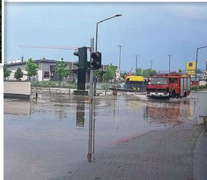
Auf den Straßen in der Stadt war umsichtiges Fahren angesagt: Kleine und auch größere Seen hatten sich auf den überspülten Wegen gebildet, wie hier im Alten Kirchhainer Weg (Foto oben) und in der Alten Kasseler Straße, wo sich ein Feuerwehrauto durch die Fluten kämpfte.