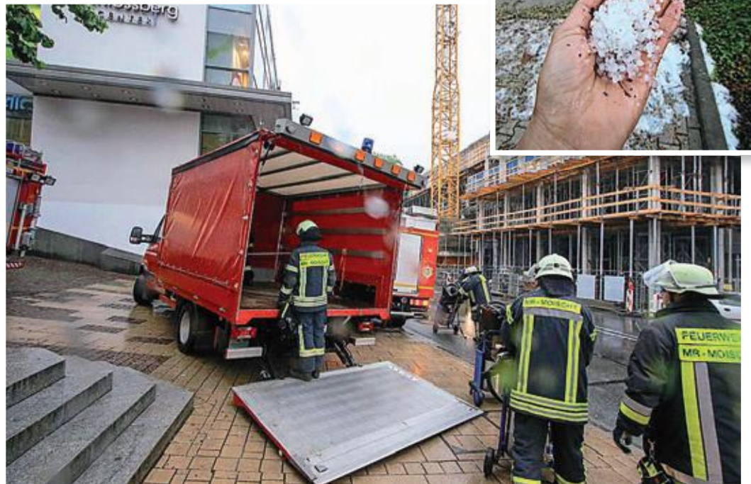
Im Schlossbergcenter pumpten die Marburger Feuerwehren auf mehreren Etagen das Wasser ab. Erst brach ein Rohr, dann stürzte eine durchnässte Decke ein. Auch Hagel kam runter.