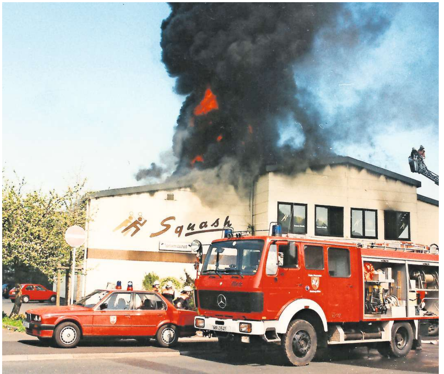
Beim Großbrand im Marburger Squash-Center, bei dem vor 25 Jahren zahlreiche Einsatzkräfte vor Ort waren, wurden zwei Feuerwehrleute schwer verletzt.

Die Marburger Feuerwehr wurde als eine der ersten Feuerwehren in Hessen mit einer neuen Schutzausrüstung ausgestattet. Feuerwehren in ganz Deutschland sowie in Tei-