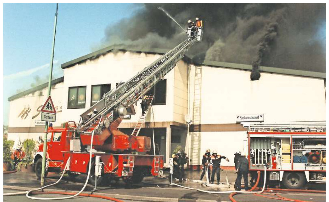
Beim Großbrand im Marburger Squash-Center waren vor 25 Jahren zahlreiche Feuerwehrleute im Einsatz.