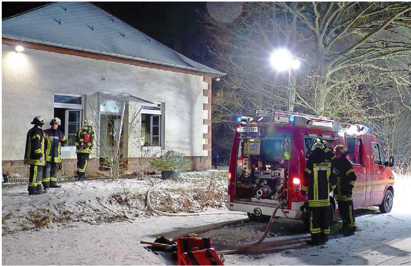
Bei dem Schmelbrand im Stadtwaldviertel konnten die Feuerwehrleute nur unter schwerem Atemschutz das Haus betreten, da erhöhte Kohlenmonoxidwerte gemessen worden waren.

„Bei der weiteren Kontrolle haben wir eine erhöhte Menge an Kohlenmonoxid auf dem Dachboden festgestellt“, erläuterte Werner. Die Werte des Gases hätten „im 600-er Bereich“