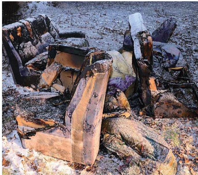
Die verkohlten Überreste des Sofas stehen vor dem Haus, in dem es gebrannt hat.

„Ergebnisse erwarten wir frühestens am Montag“, teilte Polizeisprecher Martin Ahlich mit. Der Verstorbene werde obduziert, die Brandwohnung sei versiegelt.