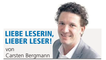
LIEBE LESERIN, LIEBER LESER! von Carsten Bergmann

Kommando zurück! Gießen hat zwar das Marburger Arbeitsgericht bekommen. Die Bußgelder, die die Blitzer auf der Stadtautobahn erknipten, gehen allerdings nicht an das Regierungspräsidium der Nachbarstadt. Präsident Wittek würde sich sicher über die Million freuen. Die Strafen, die ab Tempo 121 verhängt werden, werden vielmehr ans RP Kassel überwiesen. Gießen bekommt dafür die Gelder der Fahrer, die die Lenkzeit überschritten haben. Den Temposündern wird's egal sein. Die ärgern sich trotzdem.