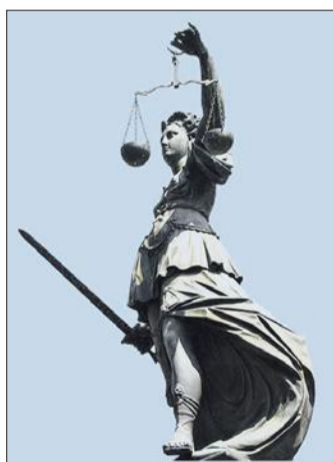
Aus dem Gericht

Marburg. Der Arzt soll an seiner minderjährigen Patientin „beischlafähnliche Handlungen vorgenommen haben, die mit dem Eindringen in den Körper verbunden waren“, wie es im Gerichtsdeutsch heißt. Der mit zwei Verteidigern anwesende Arzt bestreitet alle Vorwürfe, machte aber gestern zum Auftakt der auf vier Prozesstage angesetzten Verhandlung keine Aussage. Im Fall einer Verurteilung droht dem Arzt Berufsverbot für die Behandlung von Patientinnen unter 16 Jahren.