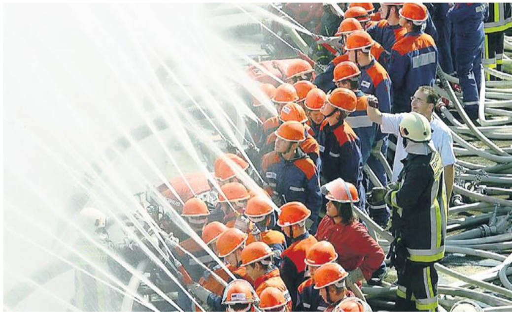
Südhessische Jugendfeuerwehren bildeten 2007 an der Mainschleuse in Mühlheim eine Wasserwand und stellten damit einen Deutschlandrekord auf. Die Hessische Jugendfeuerwehr wird 50 Jahre alt – und das wird in Marburg gefeiert.

Hessische Jugendfeuerwehr feiert 50-Jähriges · Aktionstag am Samstag bietet Abwechslung