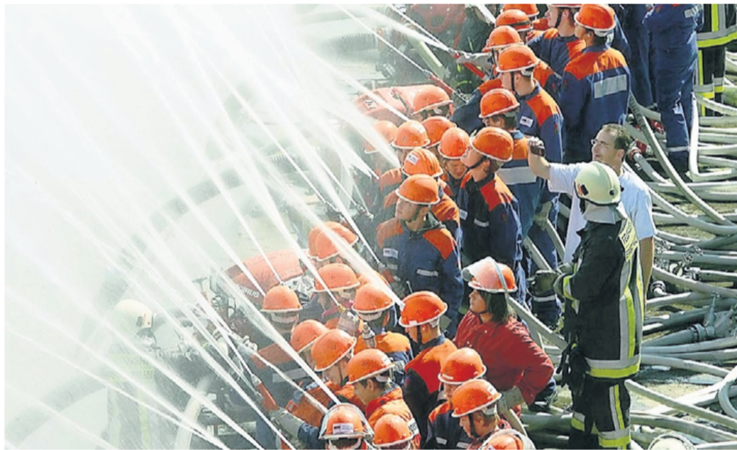
Südhessische Jugendfeuerwehren bildeten 2007 an der Mainschleuse in Mühlheim eine Wasserwand und stellten damit einen Deutschlandrekord auf. Die Hessische Jugendfeuerwehr wird 50 Jahre alt – und das wird in Marburg gefeiert.

Hessische Jugendfeuerwehr feiert 50-Jähriges · Aktionstag am Samstag bietet Abwechslung