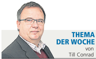
THEMA DER WOCHE von Till Conrad