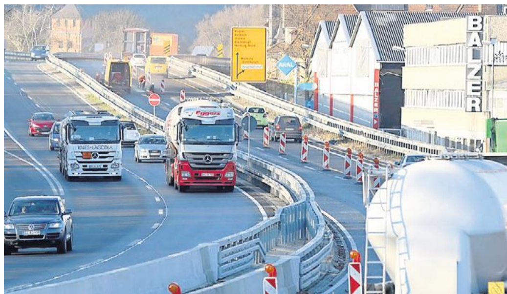
Richtung Gießen rollt der Verkehr auf der B3-Bahnhofsbücke wieder. Die Fahrer Richtung Kassel mussten sich bis heute früh gedulden.

Seit dem 27. Juli hatte Hessen Mobil die schadhafte Übergangskonstruktion an beiden Brückenenden ausgetauscht. Die Arbeiten hatten sich um mehrere Wochen verzögert, weil eine Spezialfirma die Ersatzkonstruktionen in den falschen Ausmaßen angeliefert hatte.