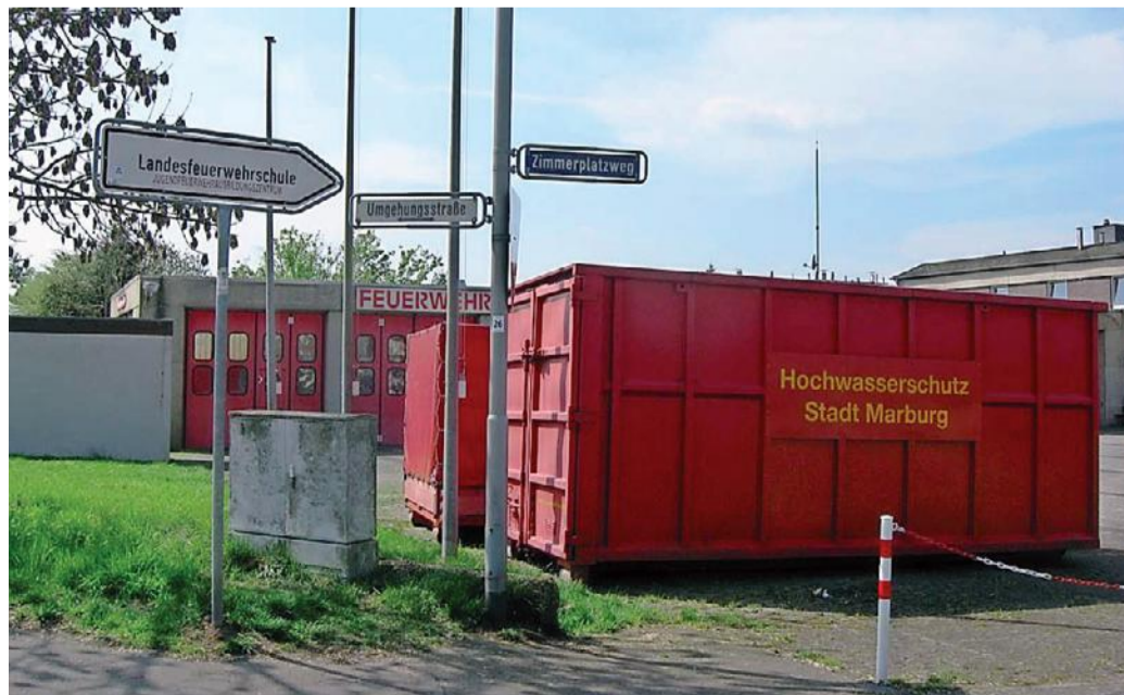
Die Landesfeuerwehrschule in Cappel soll neu gebaut werden.

Förderung der Hessischen Jugendfeuerwehren angesehen wird.