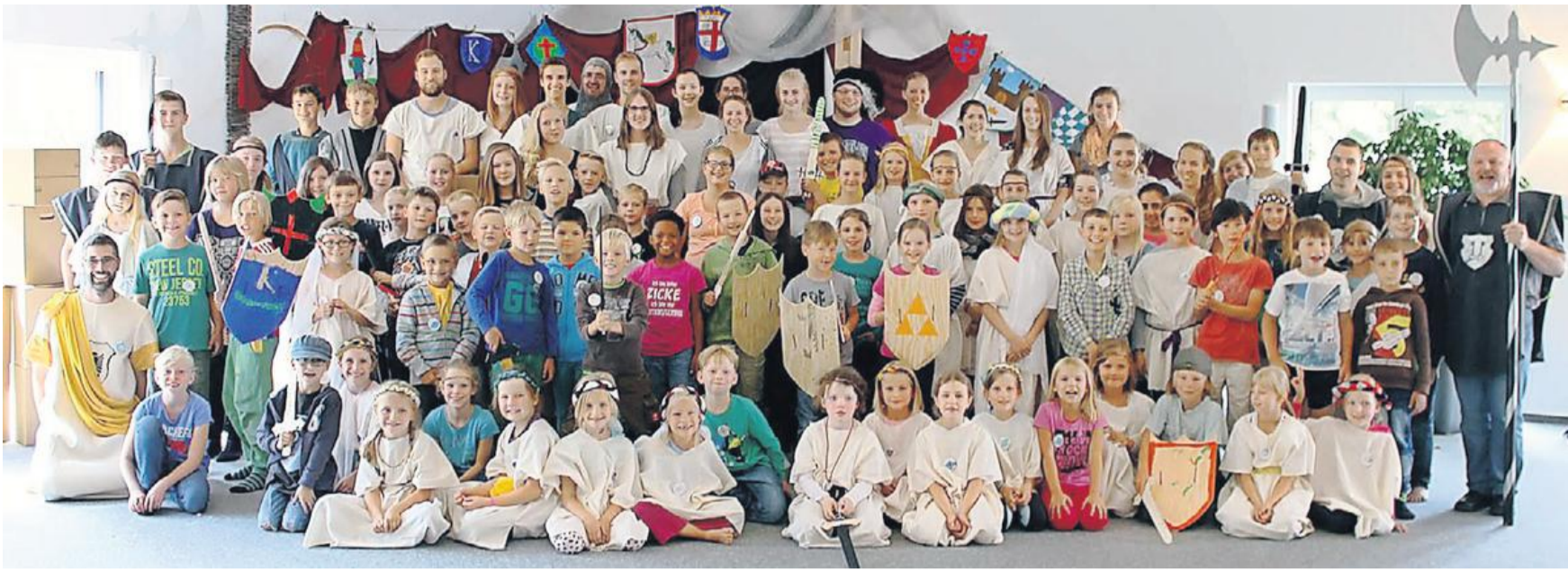
Das Ferienprogramm des CVJM wurde für 74 Jungen und Mädchen sowie die Mitarbeiter zu einer einwöchigen Reise ins Mittelalter.