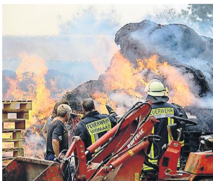
Bei Oberweimar brannten gestern Nachmittag rund 50 Rundballen. Löschtruppen brachten das Feuer unter Kontrolle.