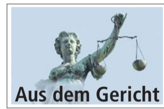
Aus dem Gericht

Die Verurteilung ist der erste Eintrag im Zentralregister der Angeklagten. Bisher sei sie „ein unbeschriebenes Blatt“ gewesen, wie Oehm sagte. Dies sei auch der Grund, warum eine Strafaussetzung zur Bewährung gerade noch vertretbar sei.