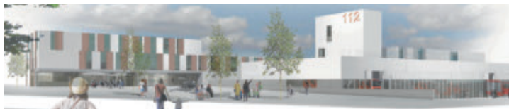
Anerkennung: Kersten + Kopp Architekten mit Schwarz Landschaftsarchitektur, Berlin