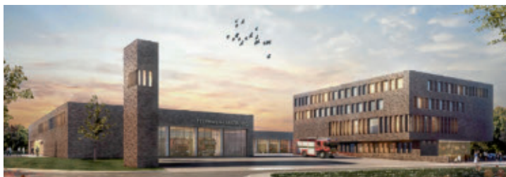
Anerkennung: Schätzler Architekten mit Kronenbitter Landschaftsarchitekten, München