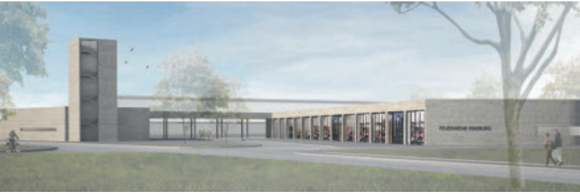
3. Preis: dasch zürn architekten, Stuttgart, mit Johann Senner, Überlingen