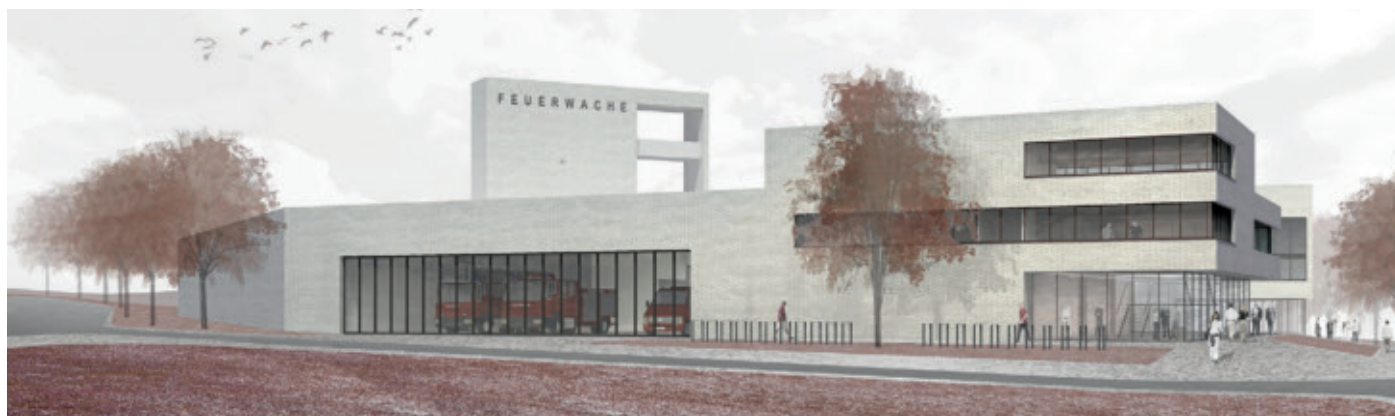
1. Preis: pussert kosch architekten mit Storch.Landschaftsarchitektur, Dresden

gesetzt, so dass Vorzonen mit Grünflächen, den Eingangsbereichen und Stellplätzen für die Einsatzkräfte entstehen. Der Innenhof bleibt als Übungs- und Freizeitfläche frei. Der Entwurf zeige ein „prägnantes, kompaktes Ensemble von hoher städtebaulicher Signifikanz, das alle wesentlichen Funktionen wie selbstverständlich erfüllt“, so das Preisgericht in seiner Beurteilung. Die Baukörper könnten durch „ihre räumliche Komposition interessante skulpturale Aspekte entfalten“, das „repräsentative Foyer“ habe eine „gute Fernwirkung“ und die helle Ziegelfassade verleihe zusammen mit den dunklen Fensterbändern den Gebäuden „ein einheitliches und hochwertiges Erscheinungsbild“, betonten die Preisrichter. Die funktionalen Abläufe seien ebenfalls „gut abgebildet“: „Die Einsatzkräfte erreichen die Wache kreuzungsfrei und die Umkleiden auf kurzem Weg“ zudem könnten die Einsatzfahrzeuge „störungsfrei ausrücken“. Den Auslobern emp-