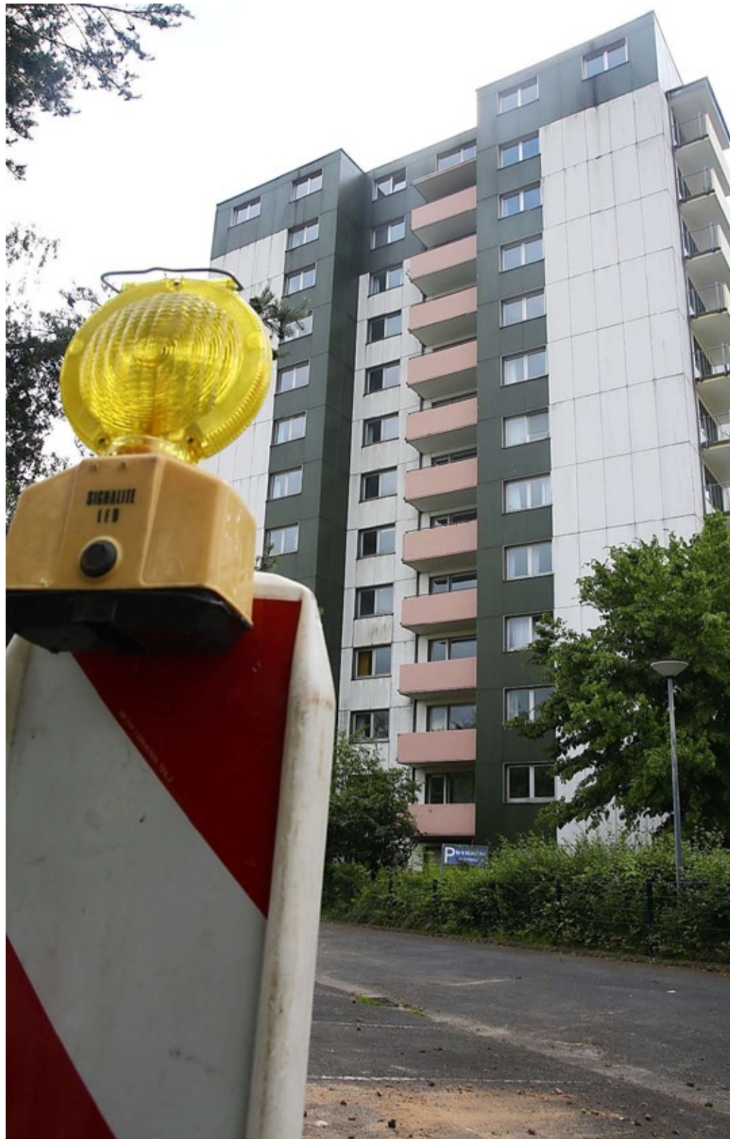
Für die Sanierung des Hochhauses „Am Richtsberg 88“ ist bereits eine Millionensumme von der Allianz-Versicherung in Richtung Studentenwerk Marburg überwiesen worden.

Zwei Sachverständige – einer von der Versicherung, einer vom Studentenwerk beauftragt – haben 2014 Gutachten über den Immobilienwert und die Schadenshöhe erstellt. Diese sind von einer Kommission geprüft und bestätigt worden. Über die Ergebnisse und die Summen ist man sich demnach einig gewesen. Gezahlt worden sei bislang aber nur für Schäden, die „unstrittig festgestellt wurden“, etwa Evakuierungskosten oder Reinigungsmaßnahmen, heißt es vom Studentenwerk. Aus der Baugenehmigung ergeben sich laut Studentenwerk jedoch Auflagen, die „erhebliche Kosten verursachen“. Diese müsse die Versicherung tragen. Solange das