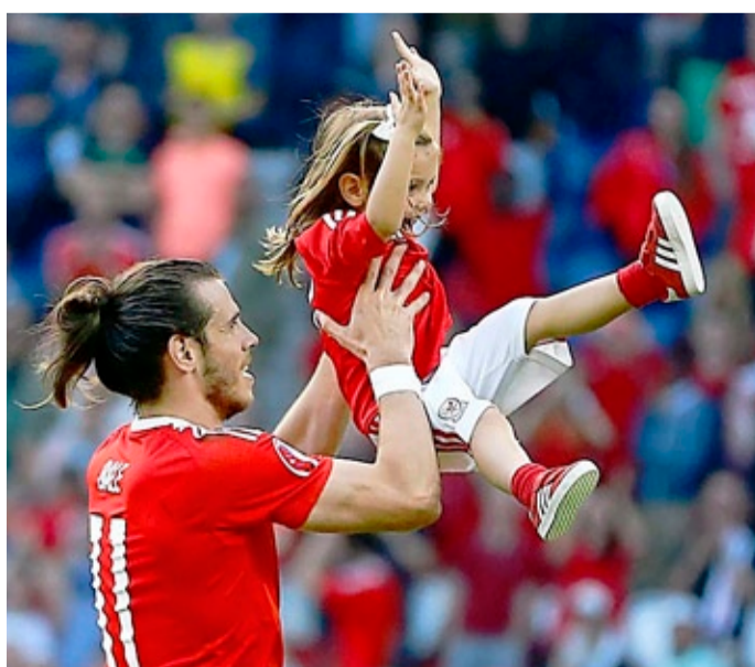
Der Waliser Gareth Bale freut sich mit seiner Tochter. Darf er weiterhin, aber nicht mehr auf EM-Rasen.

Der Uefa ist der Nachwuchs der EM-Stars ein Dorn im Auge