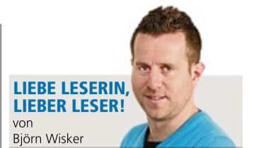
LIEBE LESERIN, LIEBER LESER!