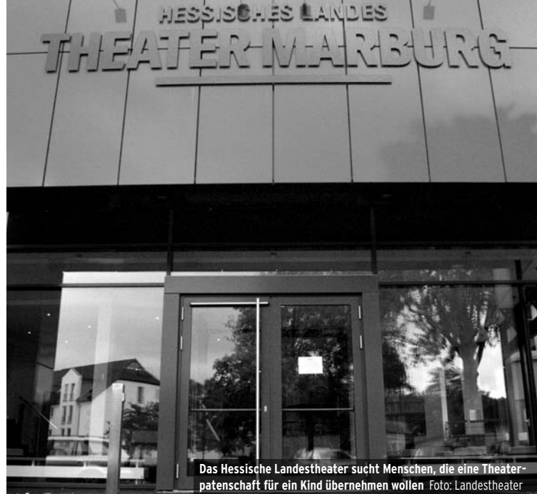
Das Hessische Landestheater sucht Menschen, die eine Theaterpatenschaft für ein Kind übernehmen wollen