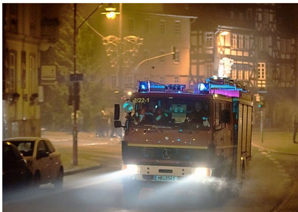
Ein Feuerwehrwagen fährt in der Silvesternacht am Pilgrimstein entlang.