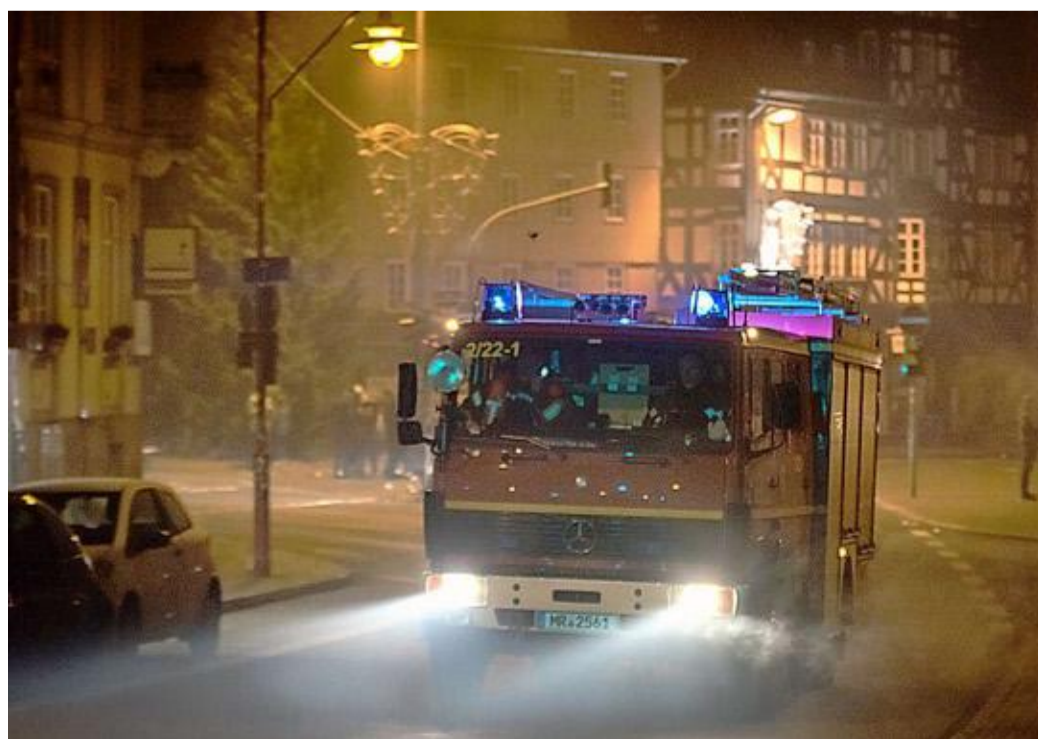
Ein Feuerwehrwagen fährt in der Silvesternacht am Pilgrimstein entlang.