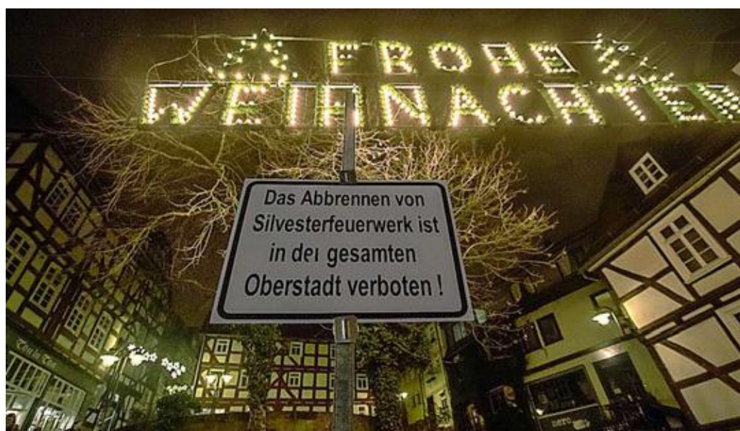
Dieses Hinweisschild an der Augustinertreppe in der Oberstadt wies zum Jahreswechsel 2015/2016 auf das Böllerverbot hin, das auch in dieser Silvesternacht galt.