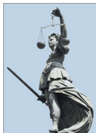
Aus dem Gericht

Der Prozess wird am kommenden Dienstag fortgesetzt.