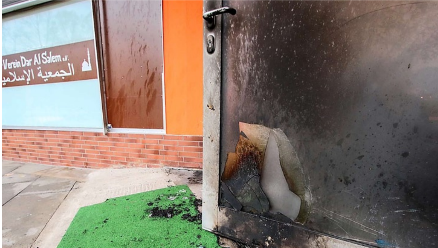
Der Metallrahmen der Tür ist versengt, die Scheiben sind geplatzt: Die Tür zum Gebetsraum der „Dar Al-Salem“-Moschee in der Friedrich-Ebert-Straße ist zerstört. Verletzt wurde bei dem Brandanschlag gestern niemand.

Das Angriffs-Datum ist für die Ermittler nach eigenen Angaben von Bedeutung: Die Nacht vom 9. auf den 10. November ist mit den Pogromen der Nazis im Dritten Reich gegen Juden verbunden – am Vorabend des Anschlags in der Friedrich-Ebert-Straße gab es wegen dieses Anlasses in Marburg eine Gedenkfeier. Die Uhrzeit des Anschlags ist zudem deckungsgleich mit dem Beginn des Zweiten Weltkriegs im Jahr 1939 (Adolf Hitler: „Seit 5 Uhr 45 wird jetzt zurückgeschossen. Und von jetzt ab wird Bombe mit Bombe vergolten! Wer mit Gift kämpft, wird