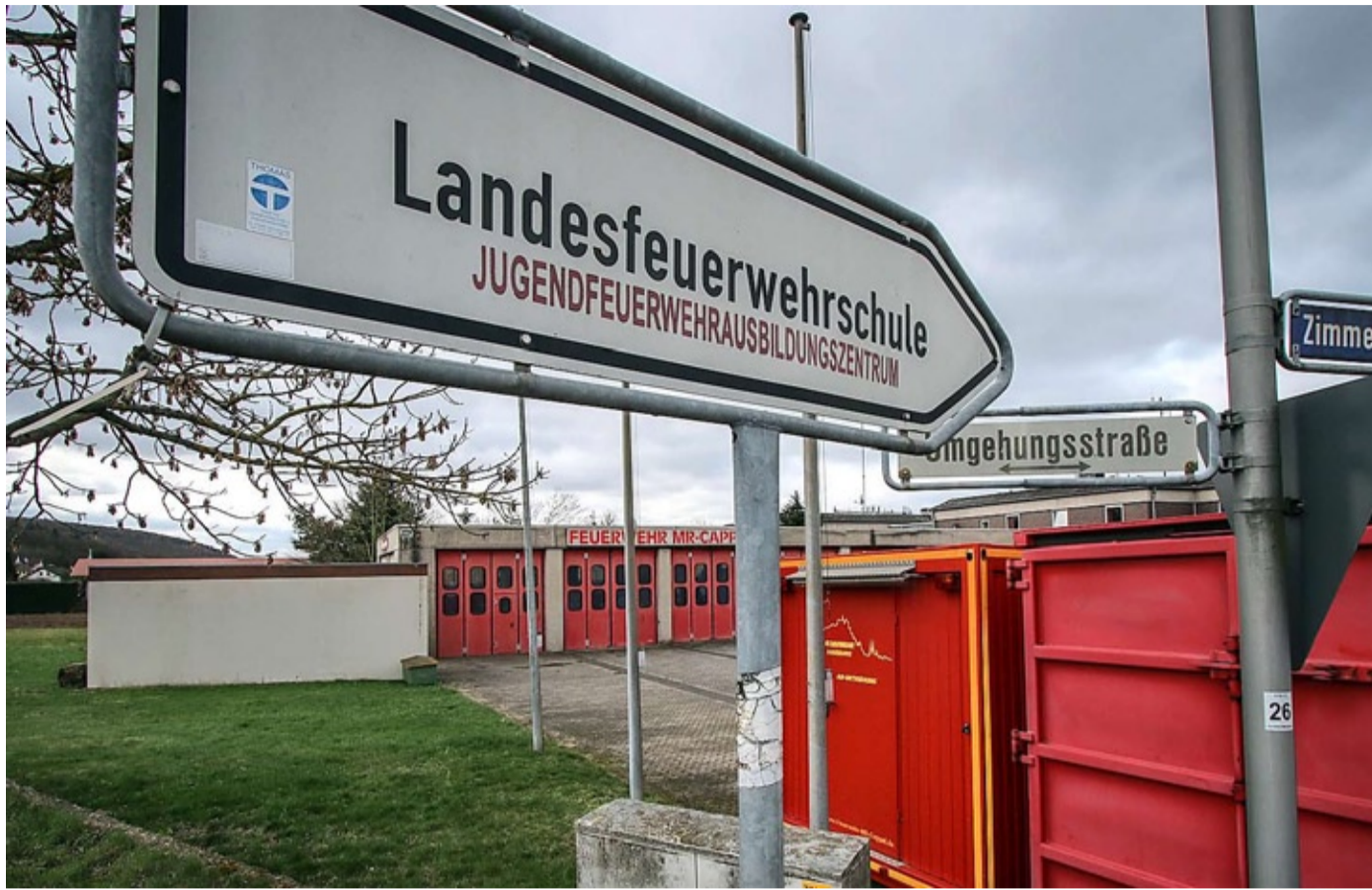
Noch immer ist ein Neubau der Feuerwache und der Landes-Jugendfeuerweherschule in Cappel nicht in Sicht.

Dass dennoch nicht gebaut werden konnte, liegt an einem Rechtsstreit, den das Land führte: Es hatte einen Architektenwettbewerb zum Neubau der Landes-Jugendfeuerweherschule ausgeschrieben. Aber nicht der Ausschreibungssieger, das Architektenbüro Pussert und Kosch in Dresden, erhielt den Auftrag zum Neubau, sondern ein anderes Büro – mit dem Ergebnis, dass der Ausschreibungssieger vor Gericht klagte.