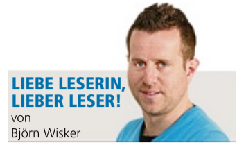
LIEBE LESERIN, LIEBER LESER! von Björn Wisler

Falls das Land sich für den Standort frühere Erstaufnahmeeinrichtung entscheide, werde die Stadt sofort mit der Feuerwehr Cappel Gespräche führen, wie eine angemessene Lösung für den Neubau der Feuerwache ohne das Land aussehen könne. „Unser Wort gilt“, sagte der Oberbürgermeister und Brandschutzdezernent. Wann aber die gegenwärtige Hängepartie um Wache und Schule ein Ende hat, konnte auch der OB nicht prognostizieren.