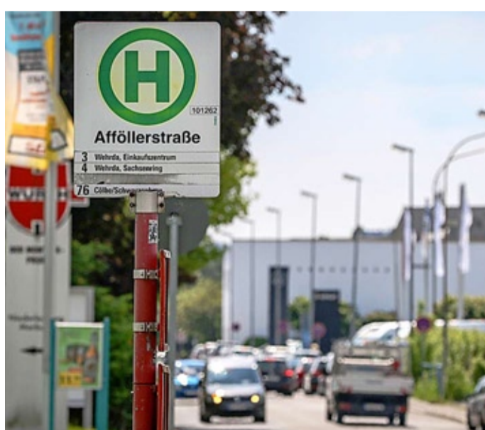
In der Zentrale eines Pizza-Lieferdienstes in der Afföllerstraße ist ein Mitarbeiter angeschossen worden.

von drei Mitarbeitern noch im Büro des Lieferdienstes anwesend war, wurde mit schweren Verletzungen ins Krankenhaus gebracht, sechs Stunden lang operiert und befindet sich mittlerweile außer Lebensgefahr. Eine Augenzeugin der Tat: seine Lebensgefährtin. Die beiden Angreifer flüchteten nach dem Abfeuern der Schüsse ohne Beute in unbekannt Richtung. „Die sofort eingeleiteten Fahndungsmaßnahmen brachten keinen Erfolg“, heißt es von den Ermittlungsbehörden. Die Hintergründe der Tat würden zudem „völlig im Dunkeln“ liegen; die Hoffnung ruht unter anderem auf Zeugen, die in der Nacht von Samstag auf Sonntag gegen 1.20 Uhr eventuell verdächtige Personen oder Fahrzeuge in der Afföllerstraße gesehen haben könnten. Seite 3