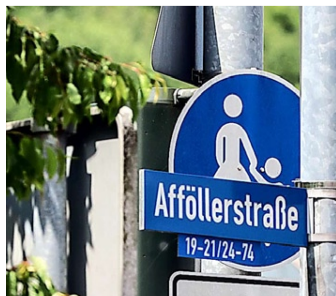
Ein Mitarbeiter eines Pizza-Lieferdienstes in der Afföllerstraße ist angeschossen worden.