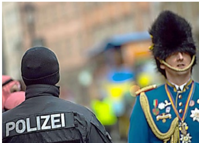
Ein Polizist beobachtet das närrische Treiben auf dem Fastnachtsumzug in Frankfurt.

xuelle Übergriffe. „Sie werden die Augen offen halten“, versicherte Ahlich. Seite 16