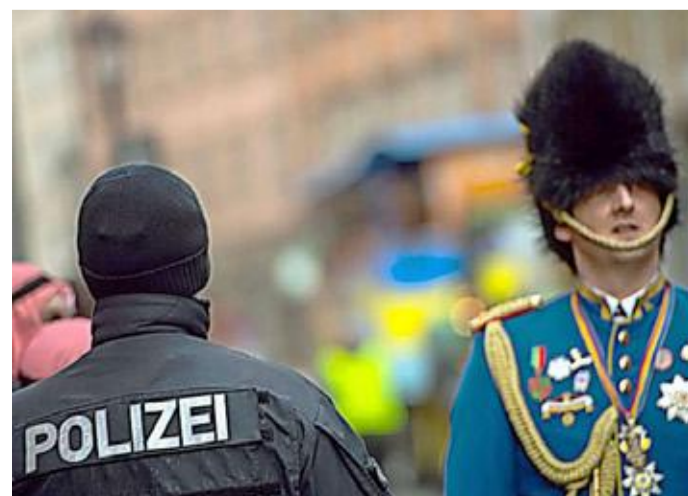
Ein Polizist beobachtet das närrische Treiben auf dem Fastnachtsumzug in Frankfurt.

xuelle Übergriffe. „Sie werden die Augen offen halten“, versicherte Ahlich. Seite 16