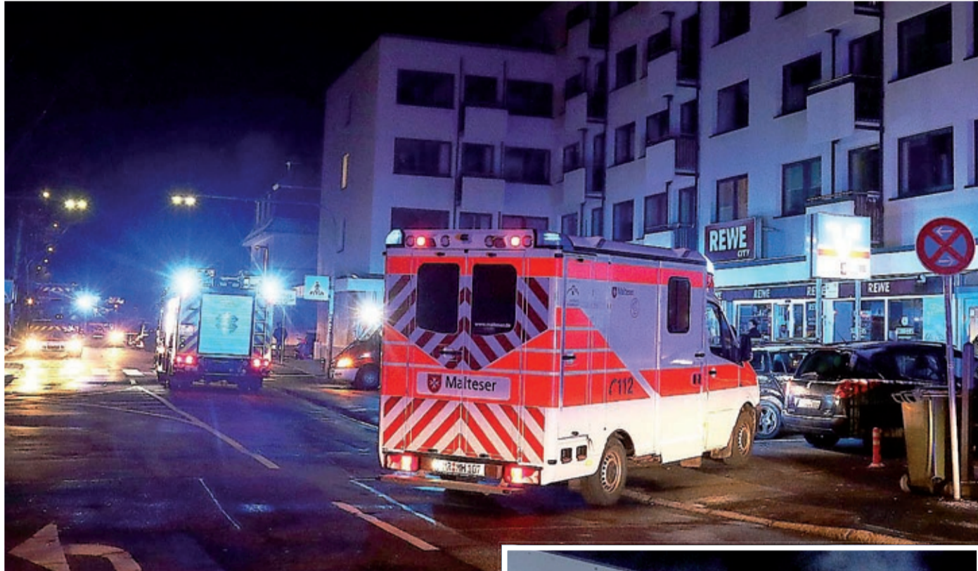
Feuerwehrleute und Rettungskräfte waren bei einem Wohnungsbrand im Einsatz.

Es war gegen 1.23 Uhr, als die Alarmierung einging: Marburger Feuerwehren wurden in die Ockershäuser Allee 7 gerufen zu einem mehrstöckigen Haus mit 30 Bewohnern. Aus einer Zweizimmer-Wohnung im ersten Obergeschoss qualmte es. Ein Feuer war im Schlafzimmer der Wohnung ausgebrochen. Rund 40 Einsatzkräfte waren so schnell vor Ort, dass sie das Feuer löschten, bevor es sich weiter ausbreiten konnte. Für eine 83-jährige Frau kam jedoch jede Hilfe zu spät. Mit Atemschutzgeräten ausgerüstete Feuerwehrleute waren über den Balkon in die Wohnung gelangt.