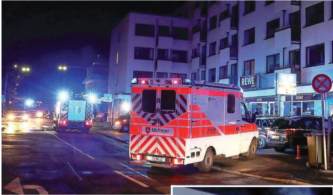
Feuerwehrleute und Rettungskräfte waren bei einem Wohnungsbrand im Einsatz.

Es war gegen 1.23 Uhr, als die Alarmierung einging: Marburger Feuerwehren wurden in die Ockershäuser Allee 7 gerufen zu einem mehrstöckigen Haus mit 30 Bewohnern. Aus einer Zweizimmer-Wohnung im ersten Obergeschoss qualmte es. Ein Feuer war im Schlafzimmer der Wohnung ausgebrochen. Rund 40 Einsatzkräfte waren so schnell vor Ort, dass sie das Feuer löschten, bevor es sich weiter ausbreiten konnte. Für eine 83-jährige Frau kam jedoch jede Hilfe zu spät. Mit Atemschutzgeräten ausgerüstete Feuerwehrleute waren über den Balkon in die Wohnung gelangt.